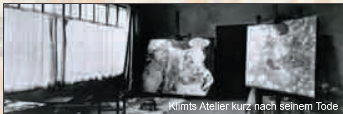
Klimts Atelier kurz nach seinem Tode

Die sogenannte Klimt-Villa, Gustav Klimts letztes Atelier (Feldmühlgasse 15a, in Unter St. Veit) ist wohl der Mehrheit der Ober St. Veiter Bevölkerung mittlerweile ein Begriff geworden. Es ist das einzig erhaltene Atelier, in dem der Einblick in das Werk eines der berühmtesten österreichischen Künstler authentisch erlebbar ist.