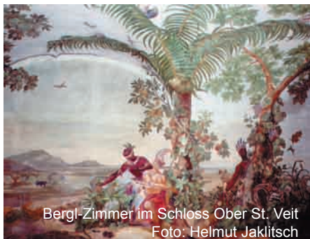
Bergl-Zimmer im Schloss Ober St. Veit